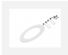
55-0002, W mezikruží pro montáž do větších otvorů