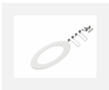
55-0002, W mezikruží pro montáž do větších otvorů