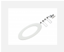
55-0002, W mezikruží pro montáž do větších otvorů