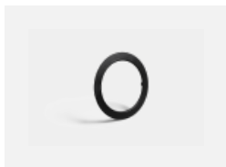
55-00001, B Ravo černý rámeček