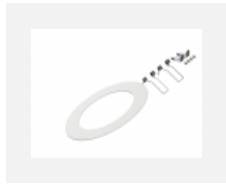
55-0002, W mezikruží pro montáž do větších otvorů