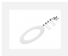
55-0002, W mezikruží pro montáž do větších otvorů