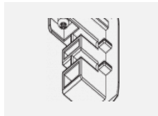
XTS41-3, white koncovka, bílá