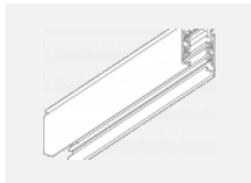
XTS4200-1, grey lišta 2m, šedá