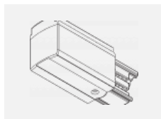
XTS11-3, white koncové napájení levé, bílá