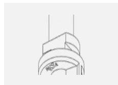
XTAK142-3, white základna háčku lanko 2mm, bílá