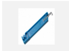
XTSV12-1, grey nástroj na ohýbání vodičů