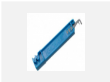
XTSV12-1, grey nástroj na ohýbání vodičů