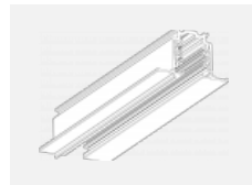
XTSCF6200-3, white lišta 2m, DALI - zapuštěná montáž, bílá