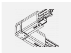
XTSC634-2, black spojka L vnitřní, DALI, černá