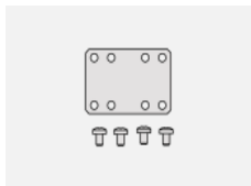
35-00200, F spoj přímý