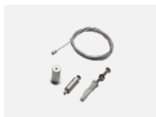
35-00300, N lankový závěs 2000mm -1 ks