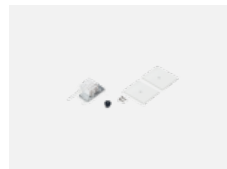
35-20101, W 2xkoncovka krátká - kov, 5pól.svorkovnice, průchodka