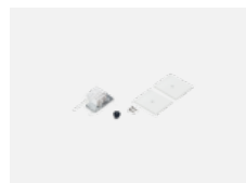
35-20101, W 2xkoncovka krátká - kov, 5pól.svorkovnice, průchodka