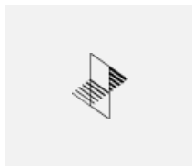
35-00111, W 2xkoncovka vestavná dlouhá - kov, 5pól.svorkovnice, průchodk