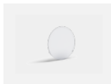
00-01100 Satinovaný difuzor