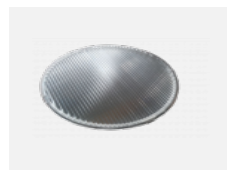
00-01101 Lineární optický systém