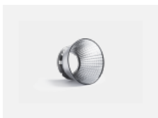
00-01002 reflektor 32°