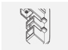
XTS41-1, grey koncovka, šedá