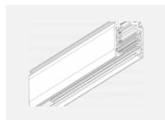
XTSC6100-3, white lišta 1m, DALI, bílá