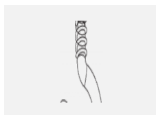
XTAK11-1, grey háček, šedá