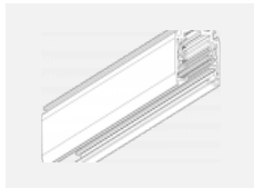
XTSC6200-3, white lišta 2m, DALI, bílá