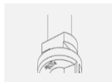
XTAK142-2, black základna háčku, černá