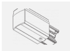
XTSC611-3, white koncové napájení levé, DALI, bílá