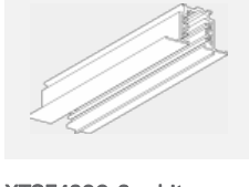
XTSF4200-3, white lišta 2m - zapuštěná montáž, bílá