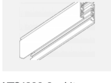
XTS4300-3, white lišta 3m, bílá