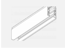
XTS4200-3, white lišta 2m, bílá