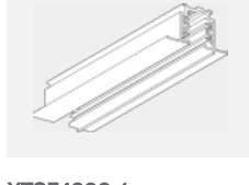
XTSF4300-1, grey lišta 3m - zapuštěná montáž, šedá