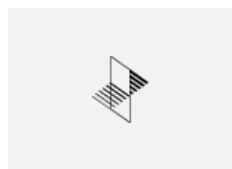
145-20700, B 2 ks úchyty na stěnu Lina45