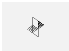
145-20700, W 2 ks úchyty na stěnu Lina45