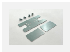
145-50200, F spoj přímý a krytky průsvitu