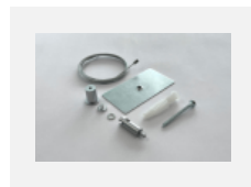
145-50303, N lankový závěs na spoj 2000mm-1 ks + kovový úchyt