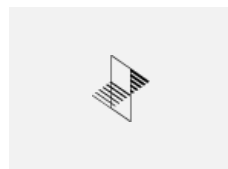
145-01200, F příslušenství k demontáži el. modulu z profilu Liny145