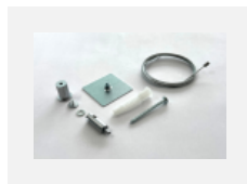
145-50302, N lankový závěs 6000mm-1 ks + kovový úchyt