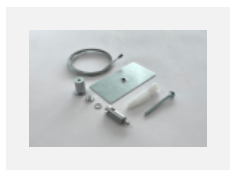
145-50305, N lankový závěs na spoj 6000mm-1 ks + kovový úchyt