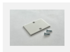
145-50101, W 2xkoncovka - kov, šroubová