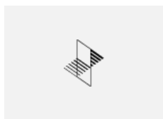
145-20700, S 2 ks úchyty na stěnu Lina45