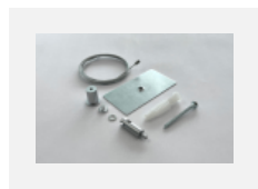
145-50304, N lankový závěs na spoj 4000mm-1 ks + kovový úchyt