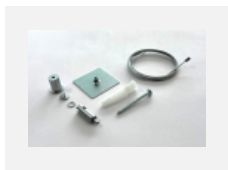
145-50300, N lankový závěs 2000mm-1 ks + kovový úchyt