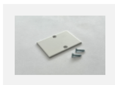
145-50101, B 2xkoncovka - kov, šroubová