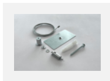
145-50305, N lankový závěs na spoj 6000mm-1 ks + kovový úchyt