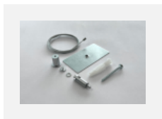
145-50303, N lankový závěs na spoj 2000mm-1 ks + kovový úchyt