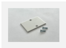
145-50101, W 2xkoncovka - kov, šroubová