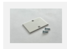
145-50101, B 2xkoncovka - kov, šroubová