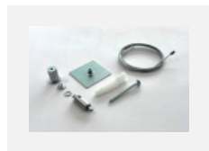
145-50302, N lankový závěs 6000mm-1 ks + kovový úchyt