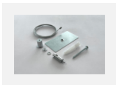
145-50304, N lankový závěs na spoj 4000mm-1 ks + kovový úchyt