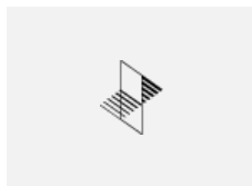
145-20700, S 2 ks úchytu na stěnu Lina45