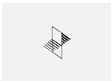
145-01200, F příslušenství k demontáži el. modulu z profilu Liny145