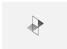
145-20700, W 2 ks úchytu na stěnu Lina45