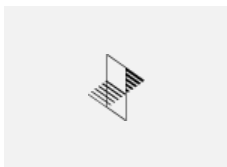
145-20700, B 2 ks úchytu na stěnu Lina45