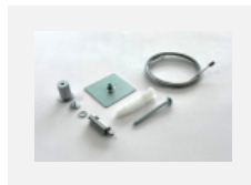
145-50300, N lankový závěs 2000mm-1 ks + kovový úchyt