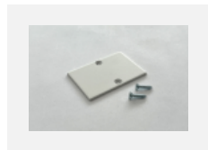
145-50101, S 2xkoncovka - kov, šroubová