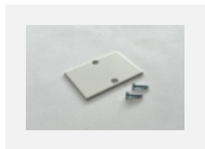
145-50101, W 2xkoncovka - kov, šroubová