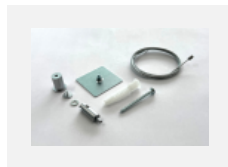
145-50300, N lankový závěs 2000mm-1 ks + kovový úchyt