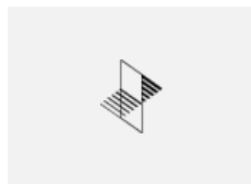
145-20700, W 2 ks úchytu na stěnu Lina45