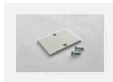
145-50101, B 2xkoncovka - kov, šroubová