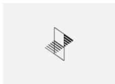
145-20700, B 2 ks úchytu na stěnu Lina45