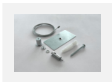
145-50304, N lankový závěs na spoj 4000mm-1 ks + kovový úchyt