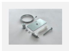
145-50303, N lankový závěs na spoj 2000mm-1 ks + kovový úchyt