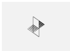
145-01200, F příslušenství k demontáži el. modulu z profilu Liny145