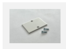
145-50101, S 2xkoncovka - kov, šroubová