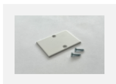
145-50101, B 2xkoncovka - kov, šroubová