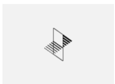
145-20700, S 2 ks úchyty na stěnu Lina45