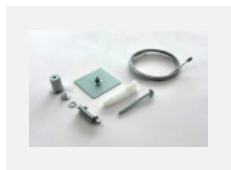
145-50301, N lankový závěs 4000mm-1 ks + kovový úchyt