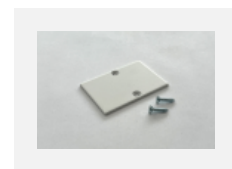
145-50101, W 2xkoncovka - kov, šroubová