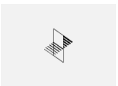
145-20700, W 2 ks úchyty na stěnu Lina45