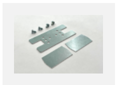
145-50200, F spoj přímý a krytky průsvitu