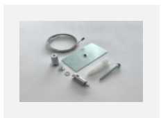
145-50305, N lankový závěs na spoj 6000mm-1 ks + kovový úchyt