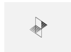
145-01200, F příslušenství k demontáži el. modulu z profilu Liny145