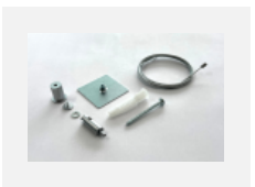
145-50300, N lankový závěs 2000mm-1 ks + kovový úchyt