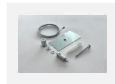
145-50303, N lankový závěs na spoj 2000mm-1 ks + kovový úchyt