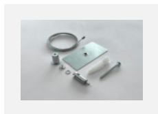
145-50304, N lankový závěs na spoj 4000mm-1 ks + kovový úchyt