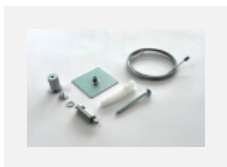
145-50300, N lankový závěs 2000mm-1 ks + kovový úchyt