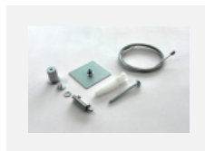
145-50302, N lankový závěs 6000mm-1 ks + kovový úchyt