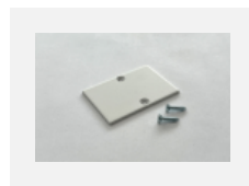
145-50101, S 2xkoncovka - kov, šroubová