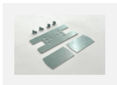
145-50200, F spoj přímý a krytky průsvitu