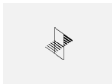
145-01200, F příslušenství k demontáži el. modulu z profilu Liny145