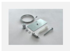
145-50305, N lankový závěs na spoj 6000mm-1 ks + kovový úchyt