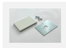
145-50102, S 2xkoncovka - kov, bezšroubová