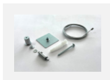
145-50301, N lankový závěs 4000mm-1 ks + kovový úchyt