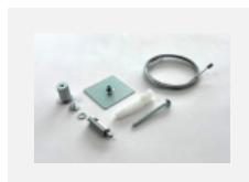
145-50302, N lankový závěs 6000mm-1 ks + kovový úchyt