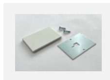
145-50102, B 2xkoncovka - kov, bezšroubová