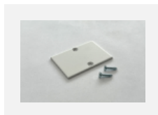
145-50101, W 2xkoncovka - kov, šroubová