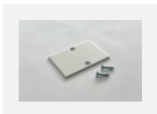
145-50101, S 2xkoncovka - kov, šroubová