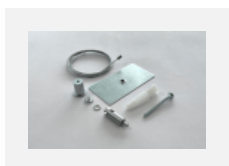
145-50305, N lankový závěs na spoj 6000mm-1 ks + kovový úchyt