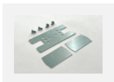
145-50200, F spoj přímý a krytky průsvitu