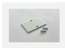
145-50101, S 2xkoncovka - kov, šroubová