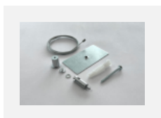
145-50305, N lankový závěs na spoj 6000mm-1 ks + kovový úchyt