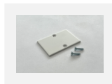
145-50101, B 2xkoncovka - kov, šroubová