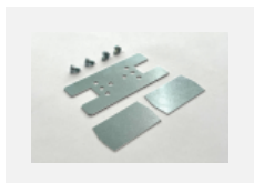
145-50200, F spoj přímý a krytky průsvitu