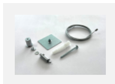
145-50301, N lankový závěs 4000mm-1 ks + kovový úchyt