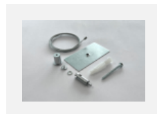
145-50303, N lankový závěs na spoj 2000mm-1 ks + kovový úchyt