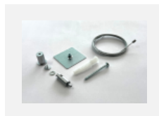
145-50302, N lankový závěs 6000mm-1 ks + kovový úchyt