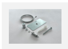
145-50304, N lankový závěs na spoj 4000mm-1 ks + kovový úchyt