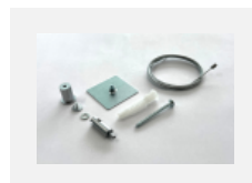
145-50302, N lankový závěs 6000mm-1 ks + kovový úchyt