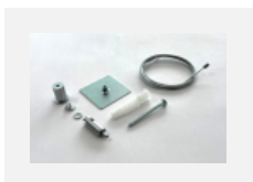
145-50300, N lankový závěs 2000mm-1 ks + kovový úchyt