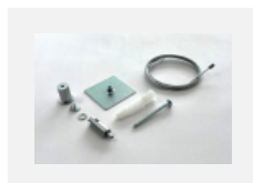
145-50302, N lankový závěs 6000mm-1 ks + kovový úchyt