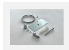
145-50303, N lankový závěs na spoj 2000mm-1 ks + kovový úchyt