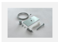
145-50304, N lankový závěs na spoj 4000mm-1 ks + kovový úchyt