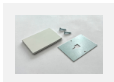
145-50102, W 2xkoncovka - kov, bezšroubová