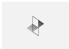
145-01200, F příslušenství k demontáži el. modulu z profilu Liny145