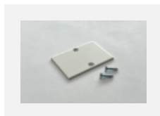
145-50101, W 2xkoncovka - kov, šroubová