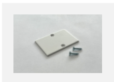
145-50101, S 2xkoncovka - kov, šroubová