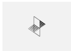
145-20700, B 2 ks úchyty na stěnu Lina45