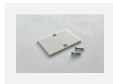
145-50101, W 2xkoncovka - kov, šroubová