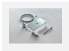
145-50305, N lankový závěs na spoj 6000mm-1 ks + kovový úchyt