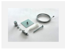
145-50300, N lankový závěs 2000mm-1 ks + kovový úchyt