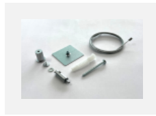
145-50302, N lankový závěs 6000mm-1 ks + kovový úchyt