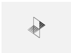
145-20700, W 2 ks úchyty na stěnu Lina45