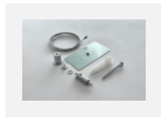
145-50304, N lankový závěs na spoj 4000mm-1 ks + kovový úchyt