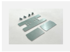
145-50200, F spoj přímý a krytky průsvitu