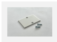
145-50101, B 2xkoncovka - kov, šroubová