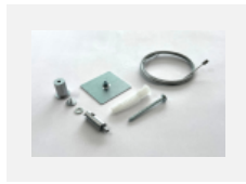
145-50301, N lankový závěs 4000mm-1 ks + kovový úchyt