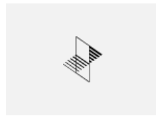
145-01200, F příslušenství k demontáži el. modulu z profilu Liny145