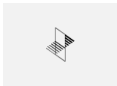
145-20700, S 2 ks úchyty na stěnu Lina45