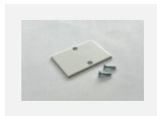
145-50101, S 2xkoncovka - kov, šroubová