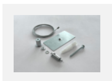
145-50303, N lankový závěs na spoj 2000mm-1 ks + kovový úchyt