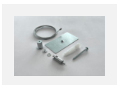
145-50304, N lankový závěs na spoj 4000mm-1 ks + kovový úchyt