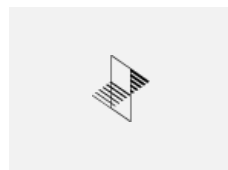
145-01200, F příslušenství k demontáži el. modulu z profilu Liny145