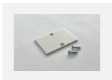
145-50101, B 2xkoncovka - kov, šroubová