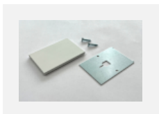
145-50102, B 2xkoncovka - kov, bezšroubová