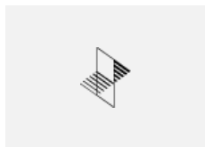
145-20700, B 2 ks úchytu na stěnu Lina45