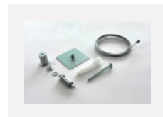
145-50301, N lankový závěs 4000mm-1 ks + kovový úchyt