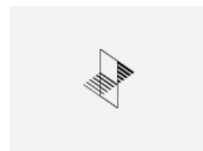
145-01200, F příslušenství k demontáži el. modulu z profilu Liny145