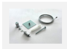
145-50300, N lankový závěs 2000mm-1 ks + kovový úchyt