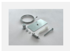
145-50304, N lankový závěs na spoj 4000mm-1 ks + kovový úchyt