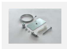
145-50305, N lankový závěs na spoj 6000mm-1 ks + kovový úchyt