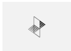
145-20700, B 2 ks úchytů na stěnu Lina45