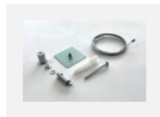
145-50302, N lankový závěs 6000mm-1 ks + kovový úchyt