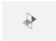
145-20700, W 2 ks úchytu na stěnu Lina45