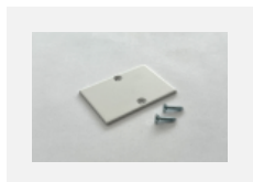
145-50101, W 2xkoncovka - kov, šroubová