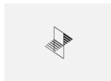
145-01200, F příslušenství k demontáži el. modulu z profilu Liny145