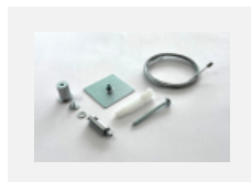
145-50300, N lankový závěs 2000mm-1 ks + kovový úchyt