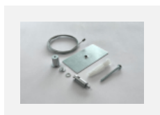
145-50303, N lankový závěs na spoj 2000mm-1 ks + kovový úchyt