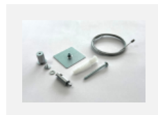
145-50301, N lankový závěs 4000mm-1 ks + kovový úchyt