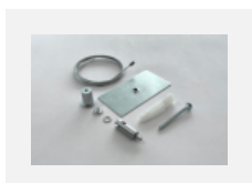
145-50304, N lankový závěs na spoj 4000mm-1 ks + kovový úchyt