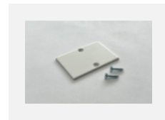
145-50101, S 2xkoncovka - kov, šroubová