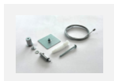
145-50302, N lankový závěs 6000mm-1 ks + kovový úchyt