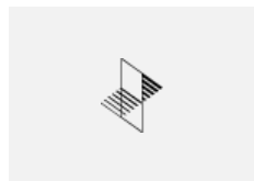
145-20700, W 2 ks úchytů na stěnu Lina45