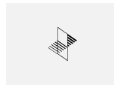
145-01200, F příslušenství k demontáži el. modulu z profilu Liny145