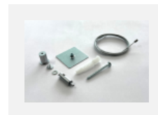
145-50301, N lankový závěs 4000mm-1 ks + kovový úchyt