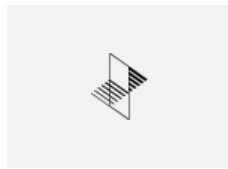
145-20700, W 2 ks úchytu na stěnu Lina45