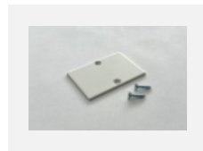
145-50101, W 2xkoncovka - kov, šroubová