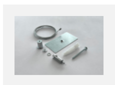
145-50305, N lankový závěs na spoj 6000mm-1 ks + kovový úchyt