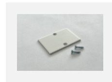
145-50101, B 2xkoncovka - kov, šroubová