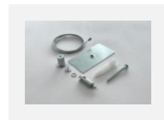
145-50303, N lankový závěs na spoj 2000mm-1 ks + kovový úchyt