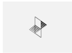
145-20700, B 2 ks úchytu na stěnu Lina45