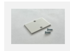
145-50101, B 2xkoncovka - kov, šroubová