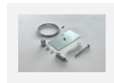
145-50303, N lankový závěs na spoj 2000mm-1 ks + kovový úchyt