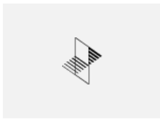
145-01200, F příslušenství k demontáži el. modulu z profilu Liny145