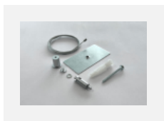
145-50305, N lankový závěs na spoj 6000mm-1 ks + kovový úchyt