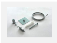
145-50301, N lankový závěs 4000mm-1 ks + kovový úchyt