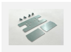
145-50200, F spoj přímý a krytky průsvitu