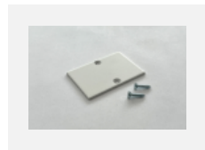
145-50101, S 2xkoncovka - kov, šroubová