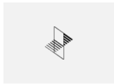
145-20700, S 2 ks úchytu na stěnu Lina45