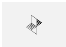
145-20700, W 2 ks úchytů na stěnu Lina45