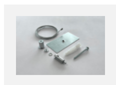
145-50304, N lankový závěs na spoj 4000mm-1 ks + kovový úchyt