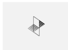
145-20700, B 2 ks úchytu na stěnu Lina45