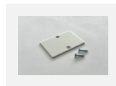
145-50101, B 2xkoncovka - kov, šroubová