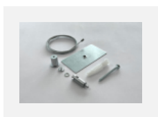
145-50305, N lankový závěs na spoj 6000mm-1 ks + kovový úchyt