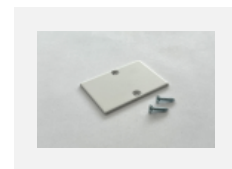
145-50101, W 2xkoncovka - kov, šroubová