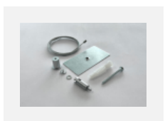
145-50305, N lankový závěs na spoj 6000mm-1 ks + kovový úchyt