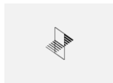
145-20700, W 2 ks úchytu na stěnu Lina45