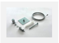
145-50300, N lankový závěs 2000mm-1 ks + kovový úchyt