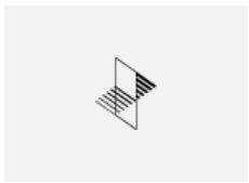
145-01200, F příslušenství k demontáži el. modulu z profilu Liny145