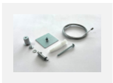
145-50301, N lankový závěs 4000mm-1 ks + kovový úchyt