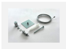
145-50300, N lankový závěs 2000mm-1 ks + kovový úchyt