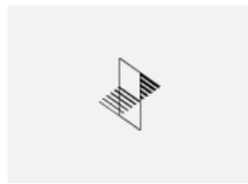
145-20700, S 2 ks úchytu na stěnu Lina45