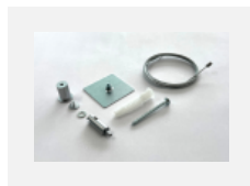
145-50302, N lankový závěs 6000mm-1 ks + kovový úchyt