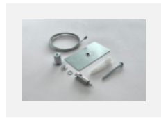
145-50304, N lankový závěs na spoj 4000mm-1 ks + kovový úchyt