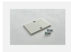
145-50101, S 2xkoncovka - kov, šroubová