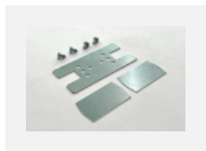
145-50200, F spoj přímý a krytky průsvitu