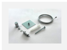
145-50301, N lankový závěs 4000mm-1 ks + kovový úchyt