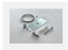
145-50303, N lankový závěs na spoj 2000mm-1 ks + kovový úchyt