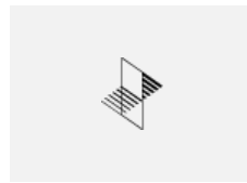
145-20700, W 2 ks úchytu na stěnu Lina45