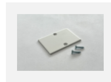
145-50101, W 2xkoncovka - kov, šroubová